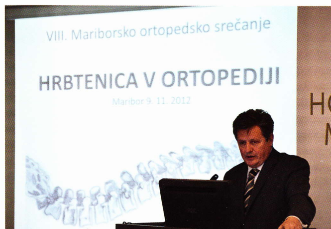
S svojim nagovorom nas je počastil direktor

V odmoru, ki je sledil, smo bili tokrat priča novosti na ortopedskem srečanju: organizacija Satelitskega simpozija za sestre, ki je popolnoma izpolnil pričakovanja medicinskih sester iz vse Slovenije