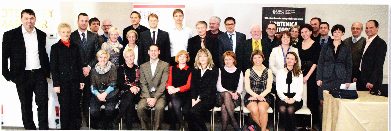
Zbrani predavatelji na srečanju